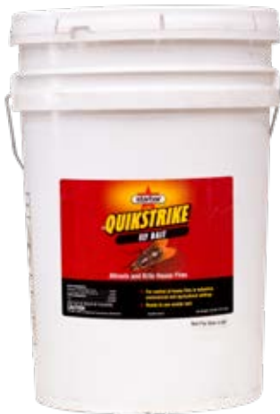
Quikstrike Fly Bait