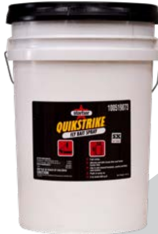
Quikstrike Fly Bait Spray