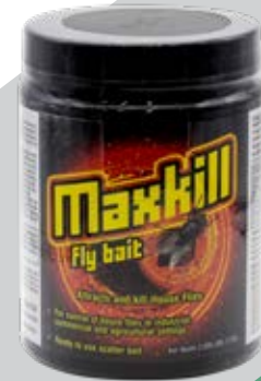
Maxkill Fly Bait